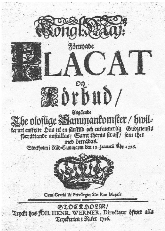
Kuva 3: Konventikkeliplakaatti